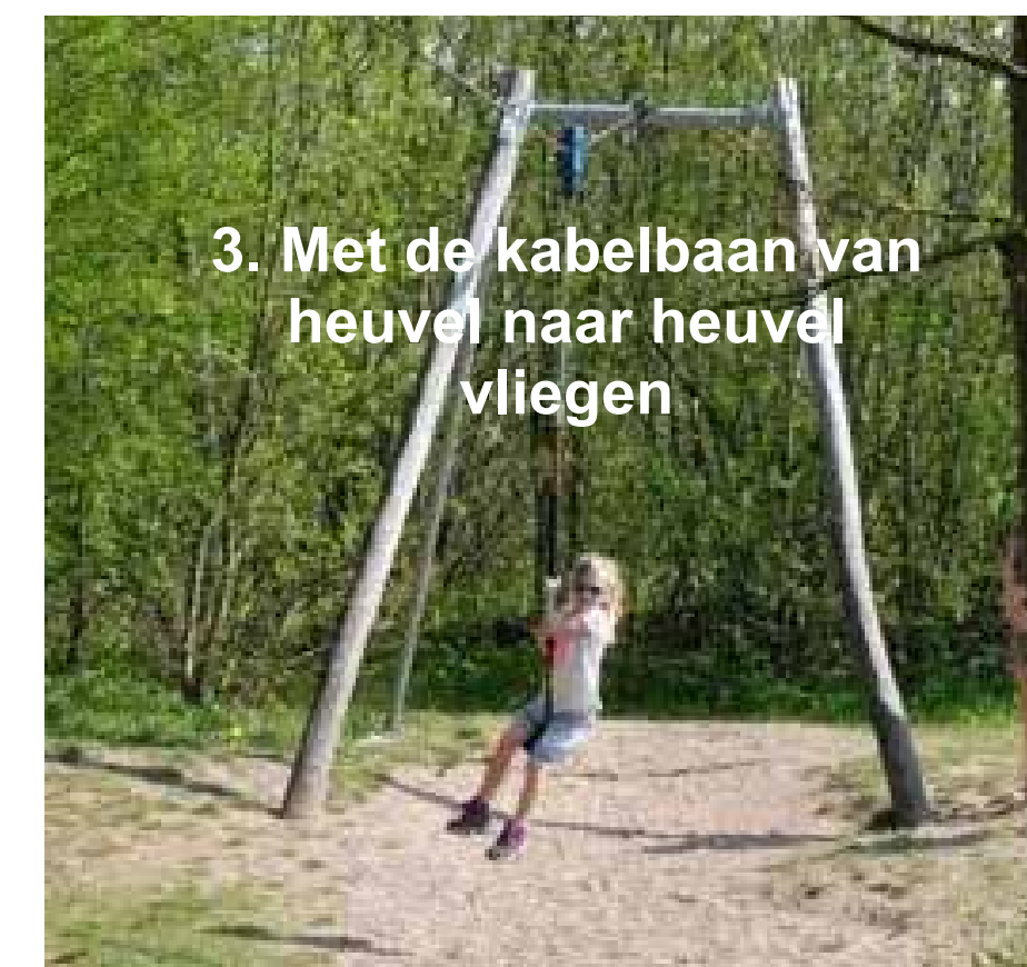
3. Met de kabelbaan van heuvel naar heuvel vliegen