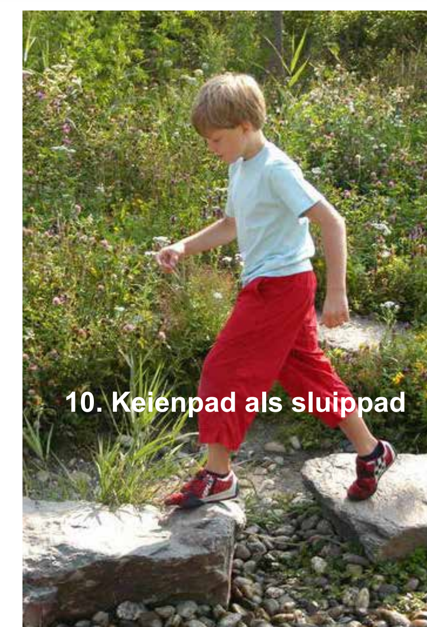
10. Keienpad als sluijpad