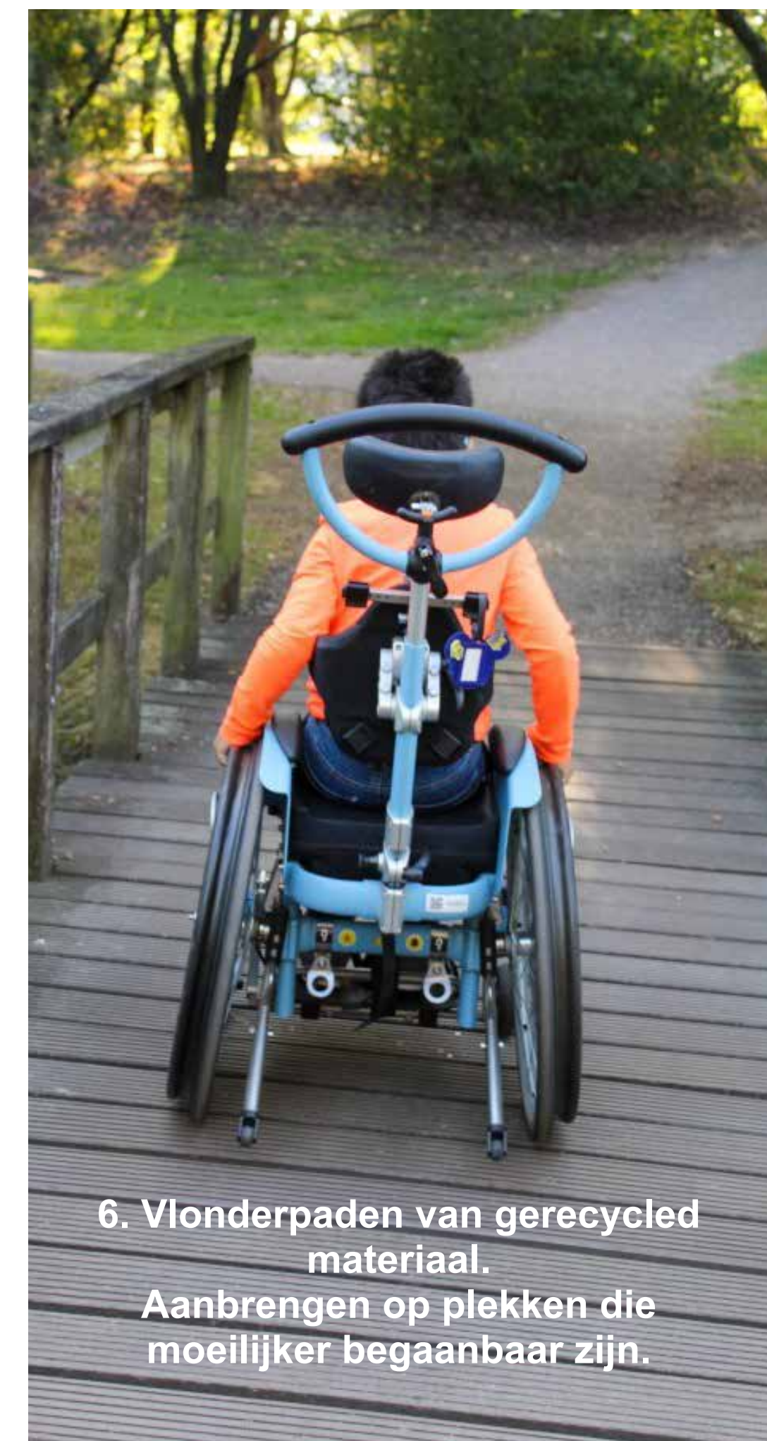
6. Vlonderpaden van gerecycled materiaal. Aanbrengen op plekken die moeilijker begaanbaar zijn.