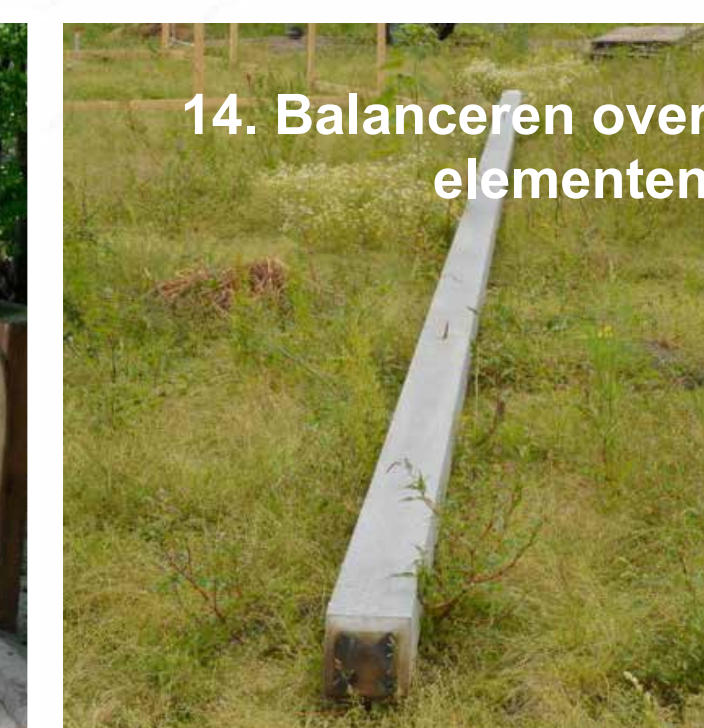
14. Balanceren over elementen