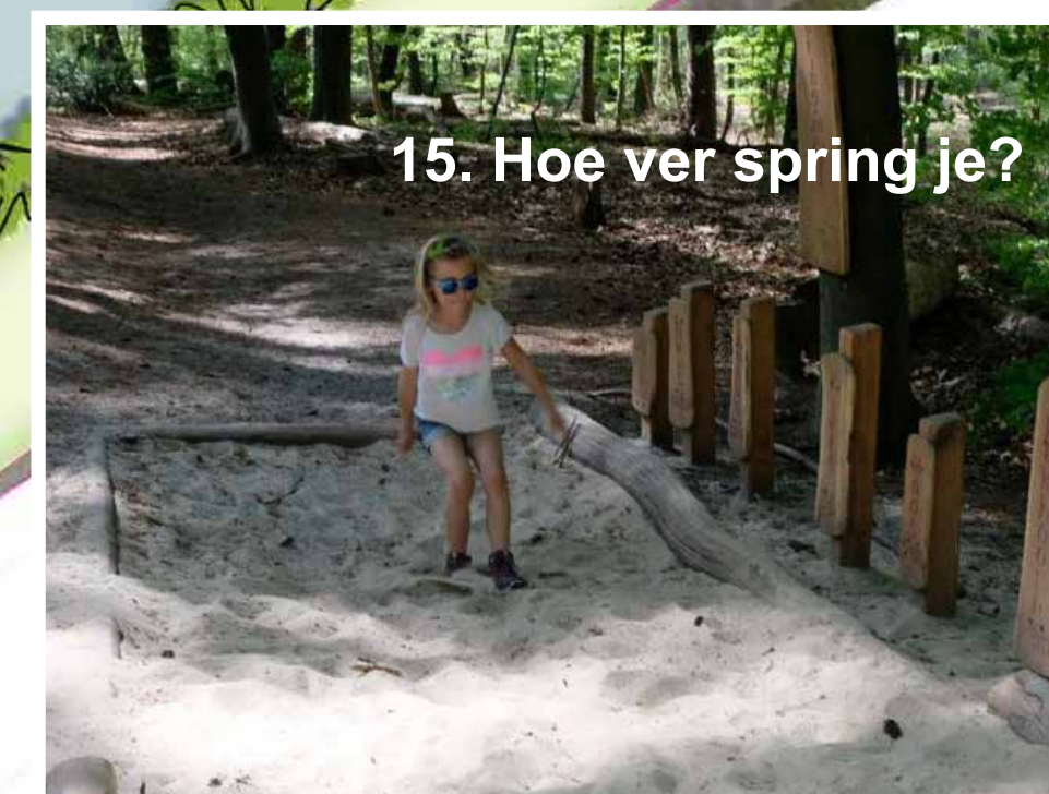
15. Hoe ver spring je?