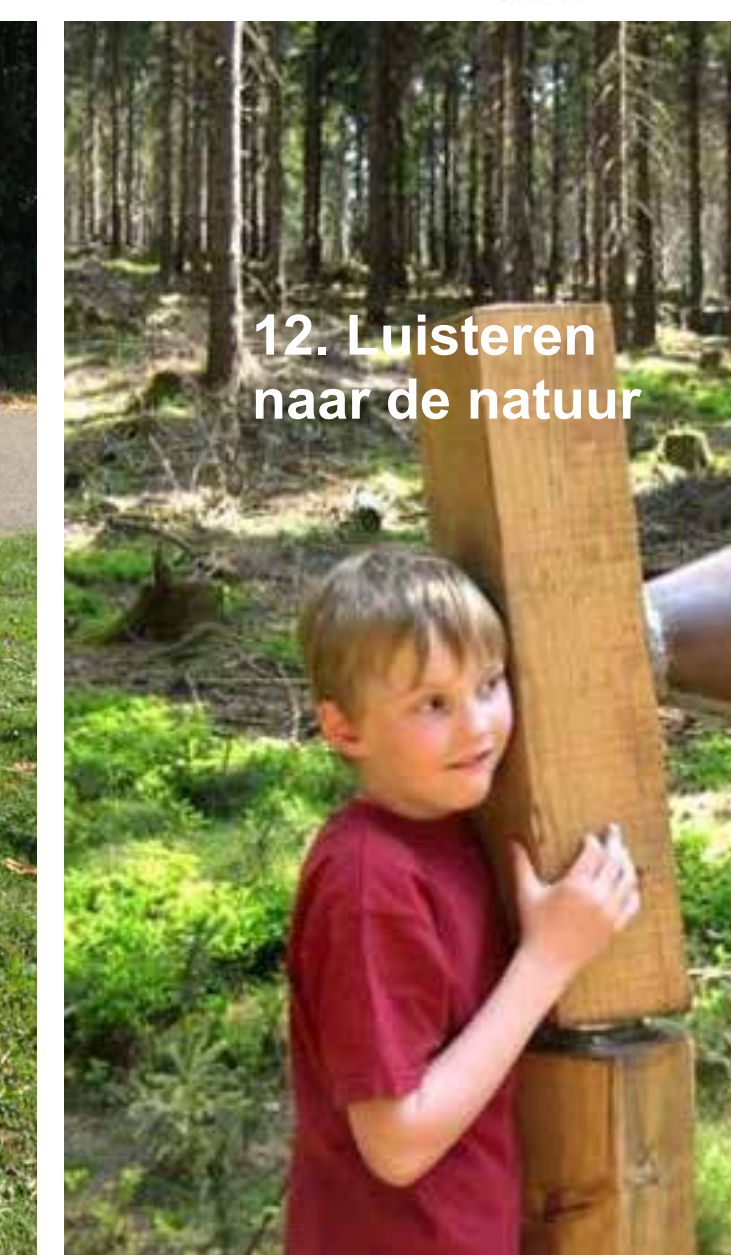
12. Luisteren naar de natuur