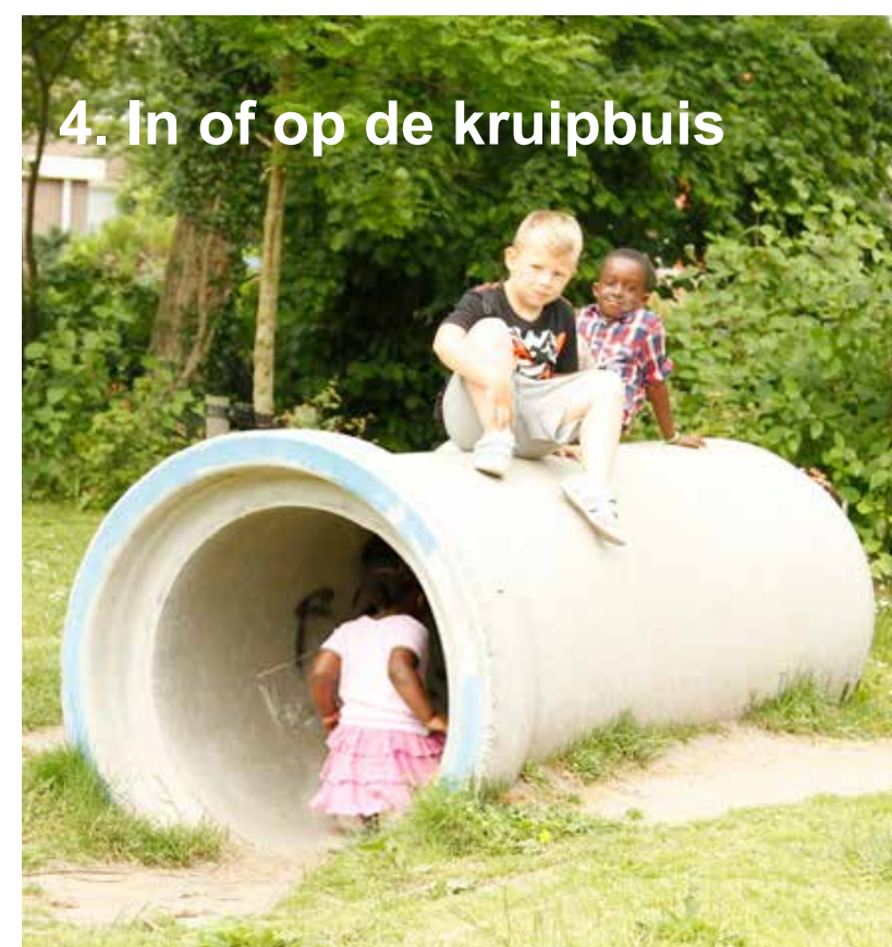
4. In of op de kruipbuis