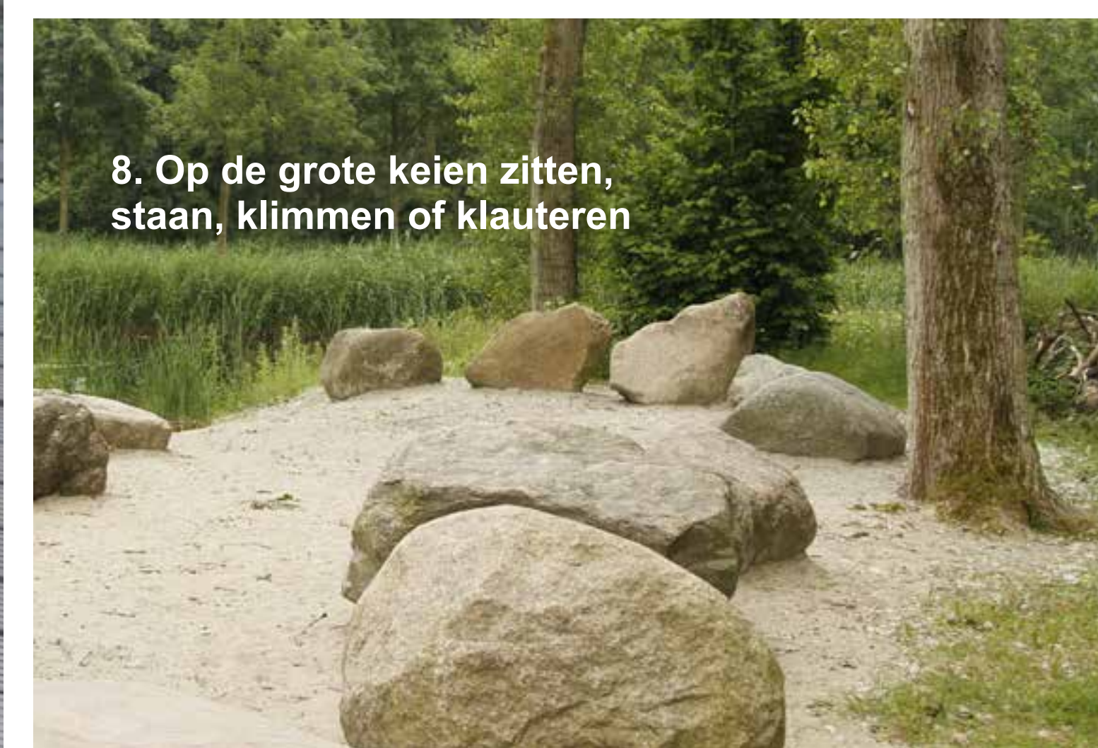
8. Op de grote keien zitten, staan, klimmen of klauteren