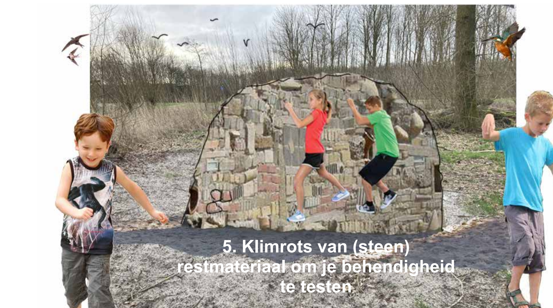
5. Klimrots van (steen) restmateriaal om je behendigheid te testen