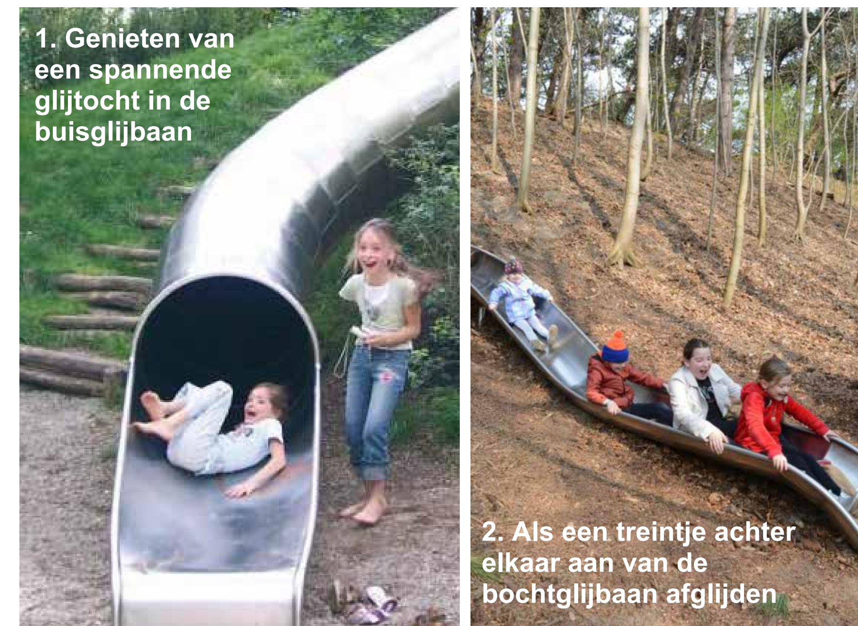
1. Genieten van een spannende glijtocht in de buisglijbaan