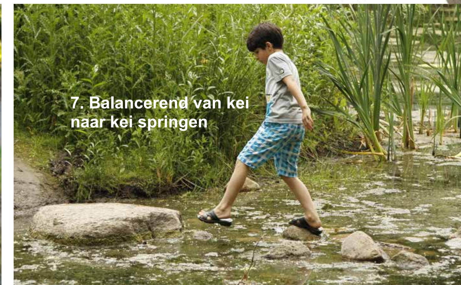
7. Balancerend van kei naar kei springen