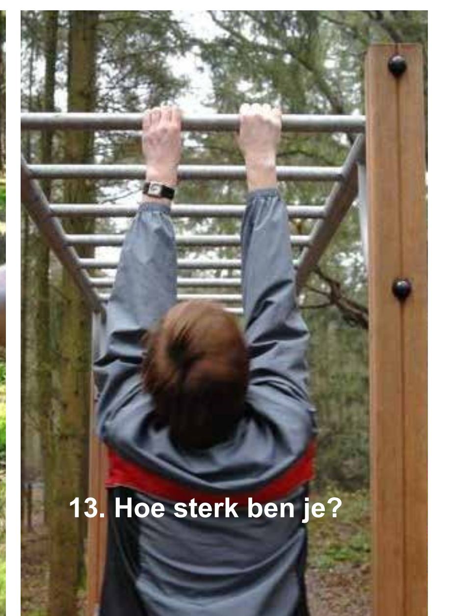
13. Hoe sterk ben je?