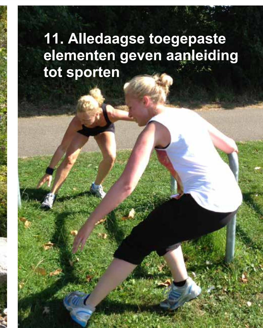
11. Alledaagse toegepaste elementen geven aanleiding tot sporten