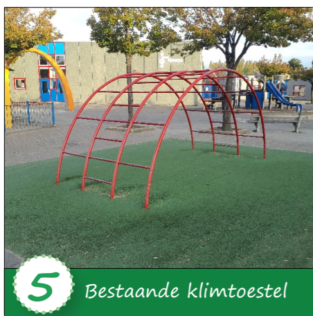
5 Bestaande klimtoestel