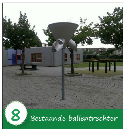
8 Bestaande ballentrechter