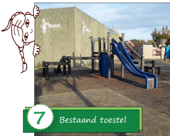
7 Bestaand toestel