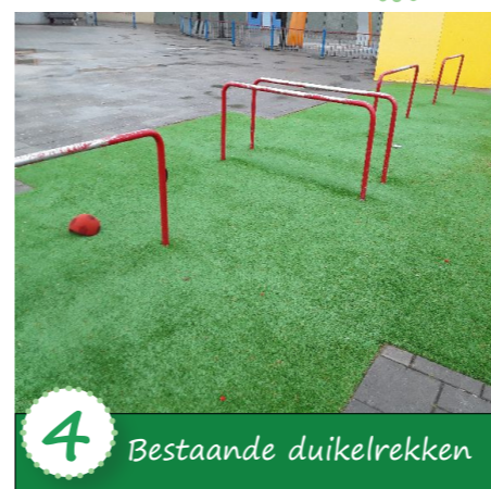
4 Bestaande duikelrekken