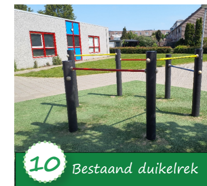
10 Bestaand duikelrek