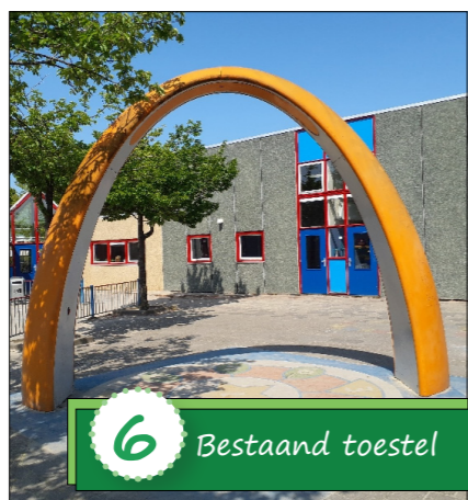
6 Bestaand toestel