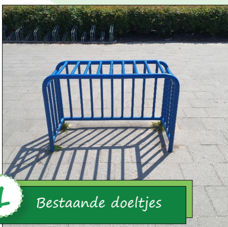
1 Bestaande doeltjes